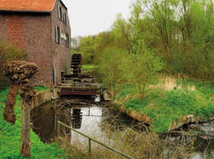
Leuther Mühle.